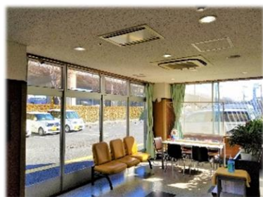
定期的な換気の実施