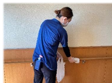
手に触れる場所の 定期的な清拭消毒