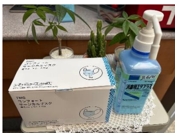
マスク着用と 手指消毒の徹底