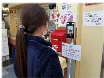
受付にて検温実施