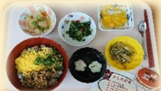
行事食～土用の丑の日～