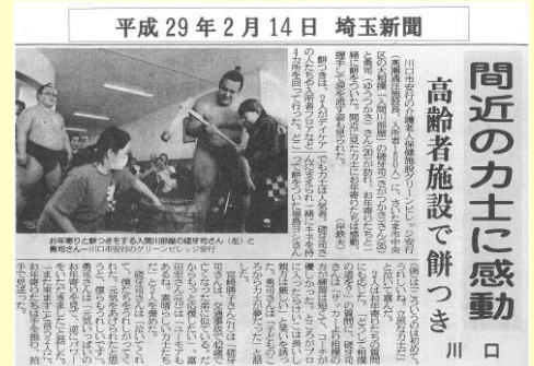
埼玉新聞に掲載されました

お相撲さんを近くで見れて嬉しかった。餅つきをしている姿がカッコよかったよ。良い思い出になったな～。（2F 入所者様）