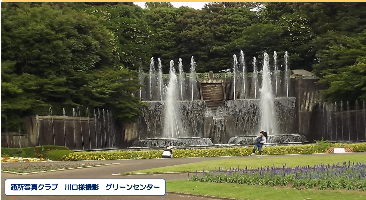
グリーンセンター

グリーンビレッジ安行のシンボルでもあるチャボヒバの木。この木のように、幾多の事にも挑戦して大きく成長していけるよう願いを込めて名付けました。