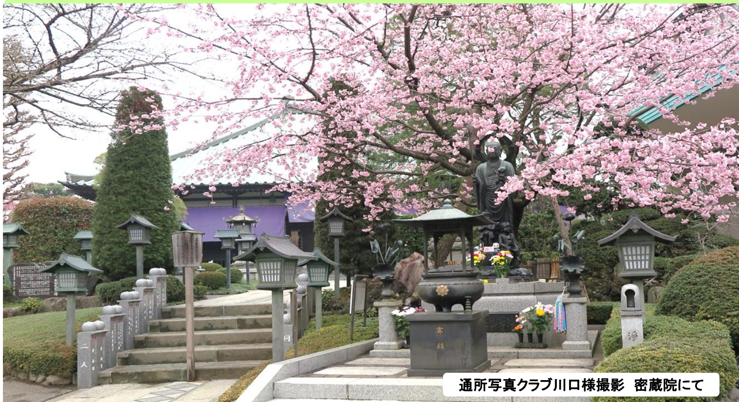
密蔵院にて

グリーンビレッジ安行のシンボルでもあるチャボヒバの木。この木のように、幾多の事にも挑戦して大きく成長していけるよう願いを込めて名付けました。