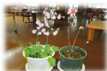
お花はしっかり咲いていました❀