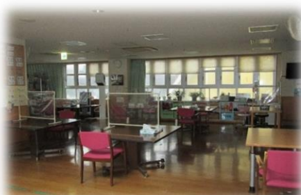
ひっそりしているデイルーム

皆様、関係者様には大変ご迷惑をおかけしておりますが、感染対策をしっかり行い、2月末頃に皆様とお会いできることを心待ちにしております。再開が決定しましたら、すぐにご連絡させていただきますので、もう暫くお待ちください。