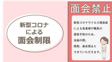
入所者様への面会制限