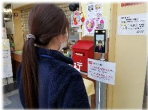
受付にて検温実施