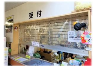
受付カウンターに 飛沫防止シート設置