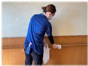
手に触れる場所の 定期的な清拭消毒